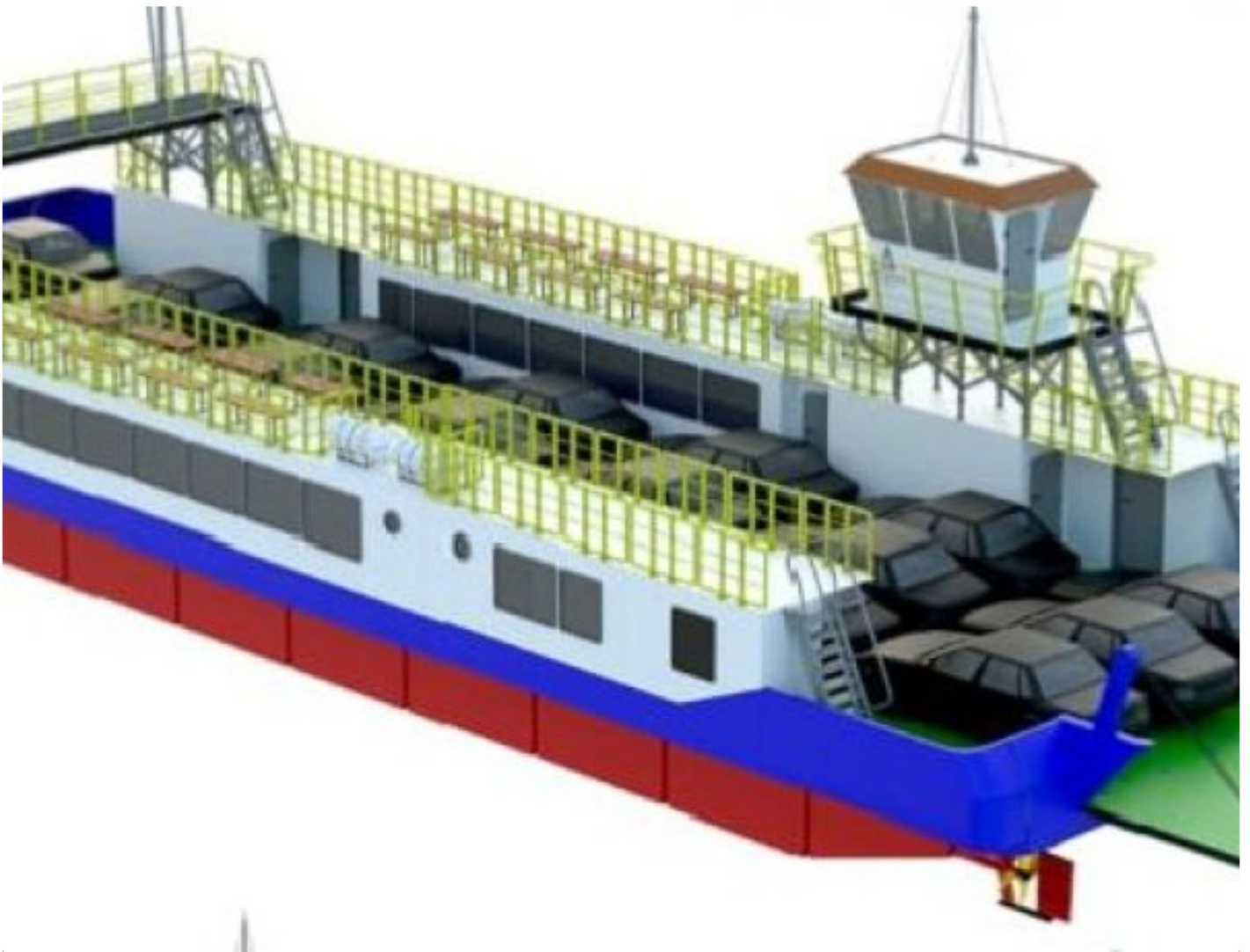
Tesk Foto : Desain Gambar Kapal Motor Penyeberangan (KMP) Sumut III

SIMALUNGUN -Guna memperlancar konektivitas wisatawan dan masyarakat menuju Pulau Samosir, Negeri Indah Kepingan Surga dari Kabupaten